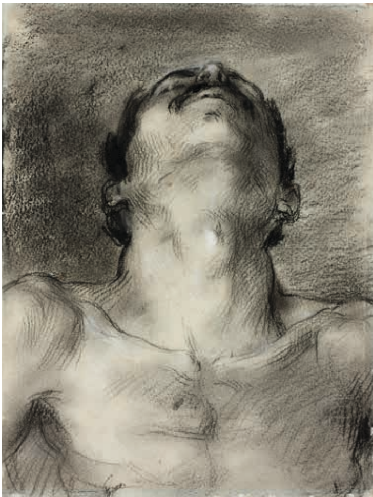
Jean-Baptiste Carpeaux, Tête d'homme levée vers le ciel , XIX e siècle, dessin au fusain, rehauts de blanc, Montpellier, musée Fabre, 06.5.8