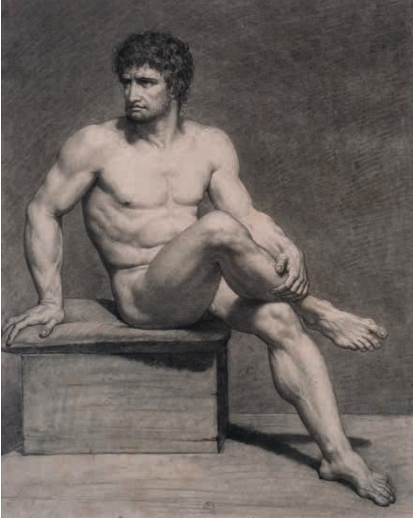
François-Xavier Fabre, Académie : homme assis , fin XVIII e siècle, pierre noire, Montpellier, Université de Montpellier, musée Atger, MA 276. Classé au titre des monuments historiques le 25 janvier 1913