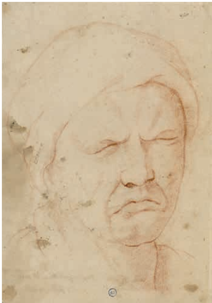
D'après Charles Le Brun, Le pleurer , XVIII e siècle, sanguine sur papier vergé, Montpellier, musée Fabre, 870.1.460