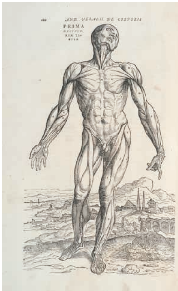
planche d'illustration, 1555, ouvrage, Montpellier, Université de Montpellier, Bibliothèque universitaire historique de médecine, Eb 87 in-fol