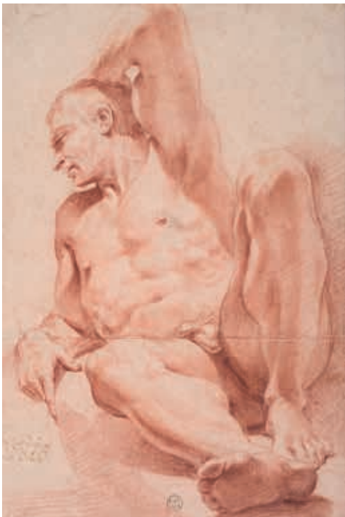
Le Dominiquin, Homme nu, assis, de face, XVII e siècle, sanguine, Montpellier, Université de Montpellier, musée Atger, MA 416. Classé au titre des Monuments Historiques le 25 janvier 1913