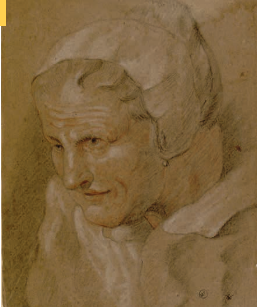
D'après Pieter Paul Rubens, Portrait de vieille femme , XVII e siècle, sanguine, rehauts de craie blanche, sur papier bleu, Montpellier, musée Fabre, 870.1.285